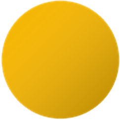
Primo Signal Yellow 1003