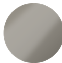
Primo Smoke Metallic