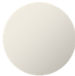
Primo Pure White 9010