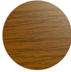
Primo Wood Golden Oak