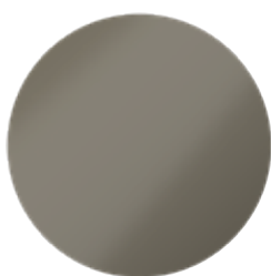
Primo Bronze Metallic