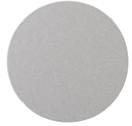
Primo Sunshine Grey