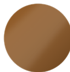
Primo Copper Metallic