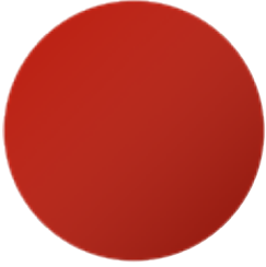
Primo Traffic Red 3020