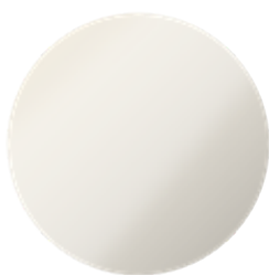
Primo Metallic White