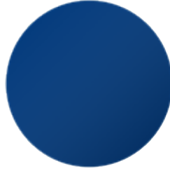
Primo Ultramarine Blue 5002