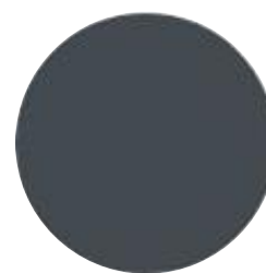
RR23 Tmavě šedá